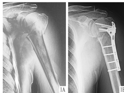
图1 肱骨近端三部分骨折 A术前; B三叶草钢板固定术后

关节活动,1周后练习肩关节前屈后伸,轻度屈肘活动,2周后开始作肩关节主动摆动锻炼,并逐渐加强。