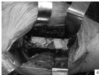
图 4 骨水泥塑形术中 图 5 骨水泥塑形术后 X 线片 图 6 术后 8 个月骨水泥表面骨痂生长

术后 X 线片可见骨水泥表面光整, 充填紧密, 外形近似股骨缺损段。术后切口均一期愈合, 无感染、积液、骨水泥毒性反应等情况发生。5 例均获随访, 时间 18 ~ 54 个月。保肢术后功能按 Enneking 肌肉骨骼系统肿瘤外科治疗重建术后功能评定标准 [1] , 对患肢的功能情况及有无畸形、相应部位的肌力、患者的生活能力及对手术效果的主观评价等因素进行综合评价: 优 3 例, 良 1 例, 可 1 例。肢体疼痛消失 4 例, 疼痛减轻的 1 例。1 例术后 18 个月死于小细胞性肺癌, 1 例肿瘤病灶局部轻度复发。骨水泥及髓内钉均无松动断裂, 还能见到骨水泥假体表面大量骨痂生长。见图 4 ~ 6。